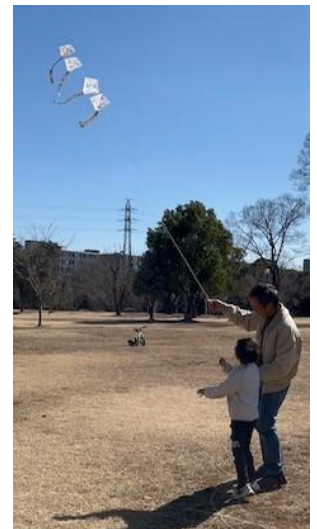
<あげているところ>