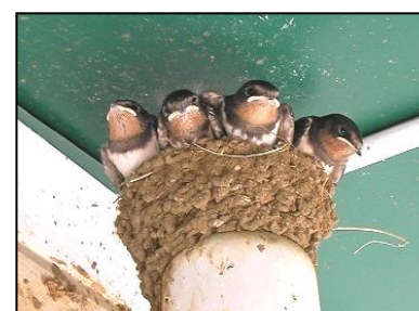
<ツバメの巣とヒナ>