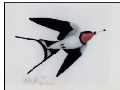
<空中で餌を捕食するツバメ>