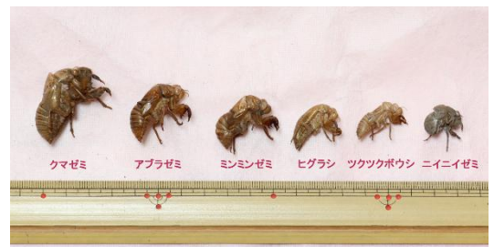
<セミの抜け殻サンプル>